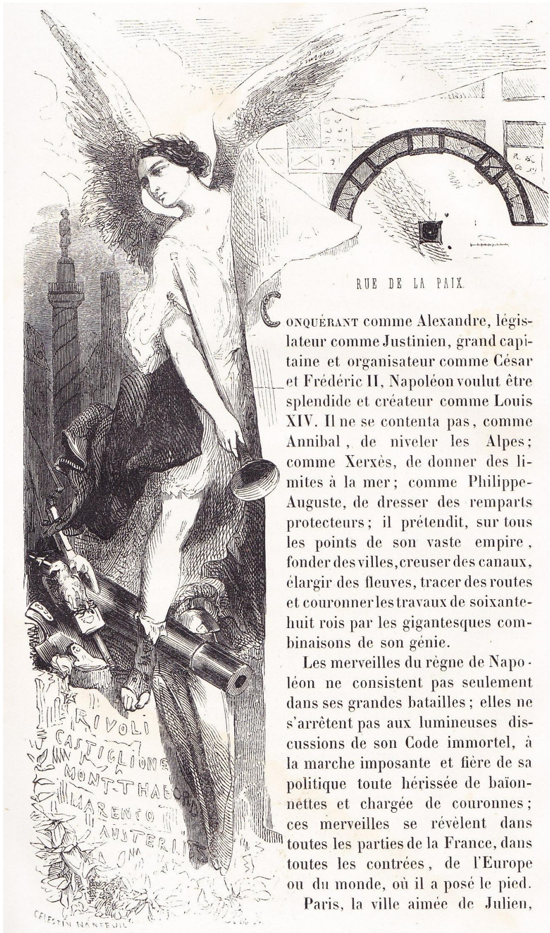
RUE DE LA PAIX.

CONQUÉRANT comme Alexandre, législateur comme Justinien, grand capitaine et organisateur comme César et Frédéric II, Napoléon voulut être splendide et créateur comme Louis XIV. Il ne se contenta pas, comme Annibal, de niveler les Alpes; comme Xerxès, de donner des limites à la mer; comme Philippe-Auguste, de dresser des remparts protecteurs; il prétendit, sur tous les points de son vaste empire, fonder des villes, creuser des canaux, élargir des fleuves, tracer des routes et couronner les travaux de soixante-huit rois par les gigantesques combinaisons de son génie.